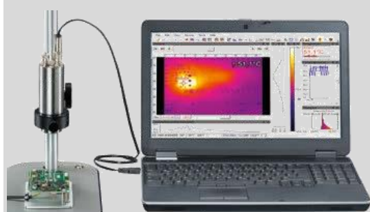
Xi400 マクロレンズキット