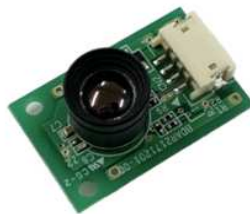
SSV32 x 32 発売中