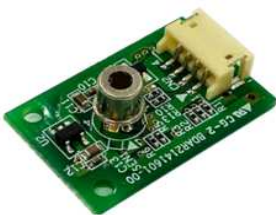
SSV8 x 8 発売中